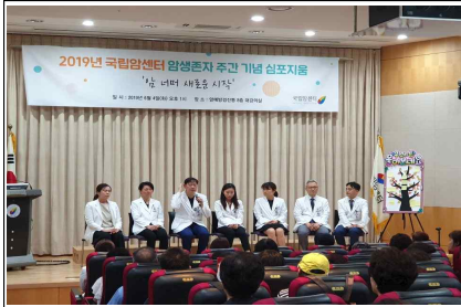
'19.6.4. 암생존자 주간 기념 심포지움