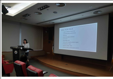
'19.11.13. 여성암생존자를 위한 강좌