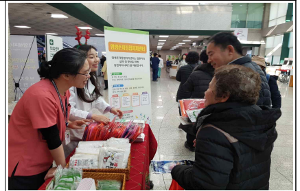
'19.12.18. 꿈 나눔 사랑 캠페인